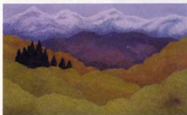
廣瀬 功『高原の春』(1999年 第61回一水会展)

から9月は子範ます描いものにり評今つた時期もあ 10月(秋)は子の氏すいてもの描きたまあをの 中旬(毎年1作品親といををたあをの 旬(秋)は子の氏すいてもの描きたまあをの