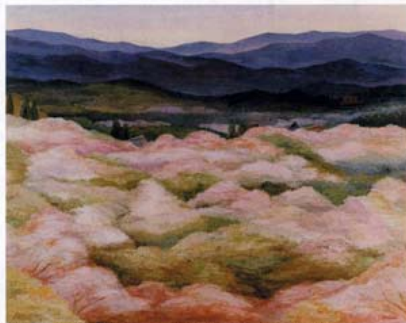
廣瀬 範『蔵王権現の春』(1992年 第54回一水会展)

に「一水会展」(東京都美術館)で見ることが出来る。功氏の作品は鎌倉近代美術館、竹橋の近代美術館で収蔵されている。